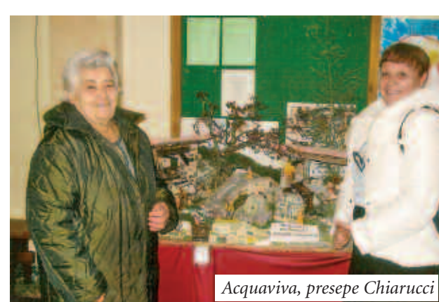
Acquaviva, presepe Chiarucci