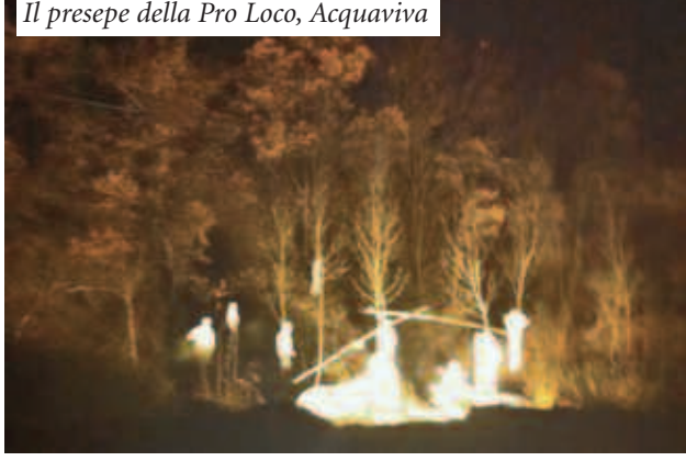
Il presepe della Pro Loco, Acquaviva