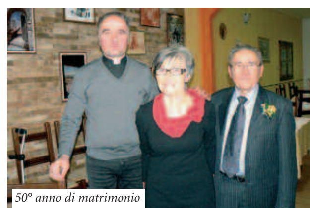
50° anno di matrimonio