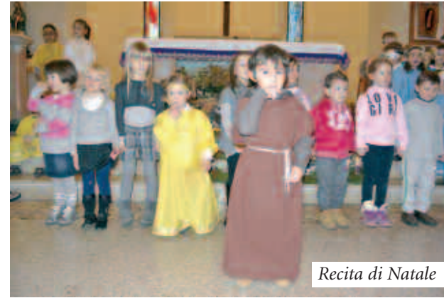
Recita di Natale