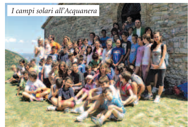
I campi solari all'Acquanera