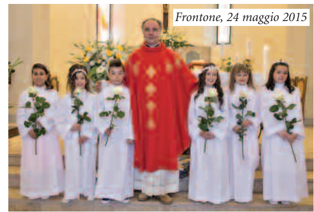
Frontone, 24 maggio 2015