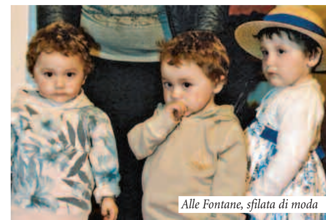
Alle Fontane, sfilata di moda