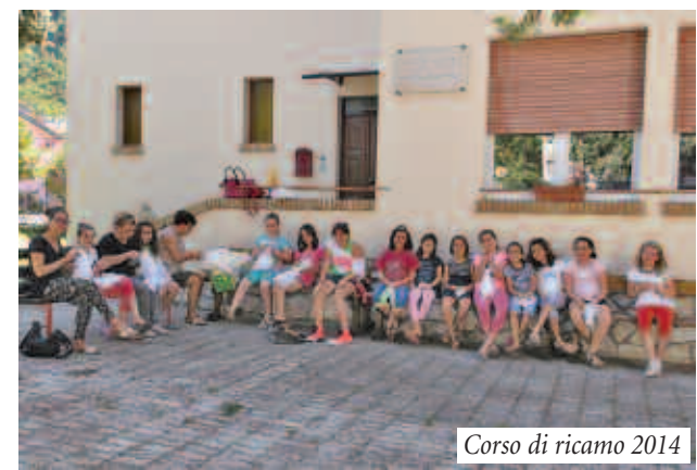
Corso di ricamo 2014