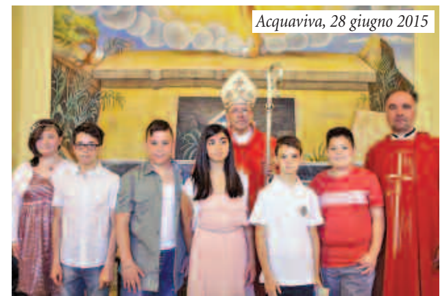
Acquaviva, 28 giugno 2015