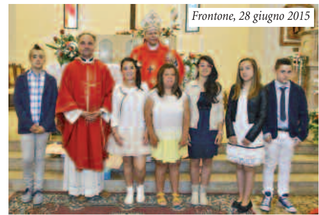
Frontone, 28 giugno 2015